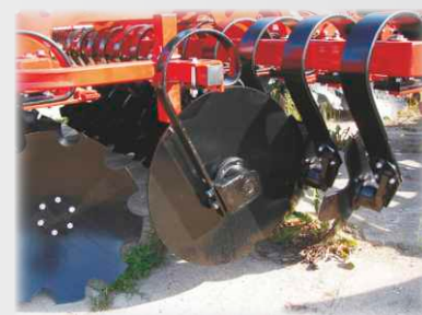
Ekran boczny II