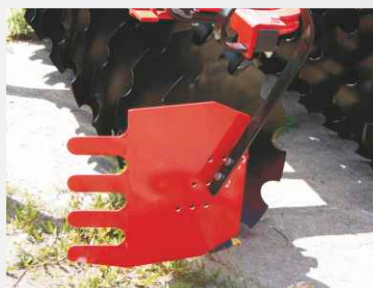
Ekran boczny I