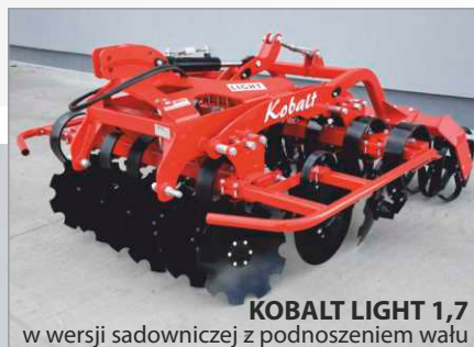
KOBALT LIGHT 1,7 w wersji sadowniczej z podnoszeniem wału

Regulacja kąta natarcia talerzy od 0° do 20°.