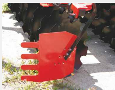
Ekran boczny I