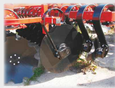
Ekran boczny II